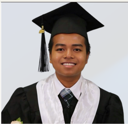
Becas por $100,000 CAD. Ofertas de University of Leeds y University of Warwick