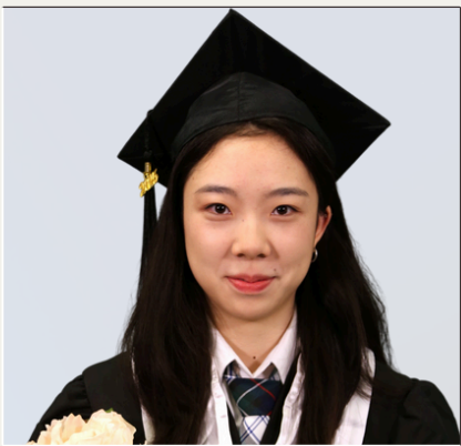
Becas por $160,000 CAD. Ofertas de University of Toronto y Western University